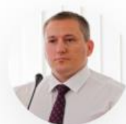
Белик Вадим Данилович

Председатель научно-экспертного совета. Член консультативной комиссии Государственного совета Российской Федерации.