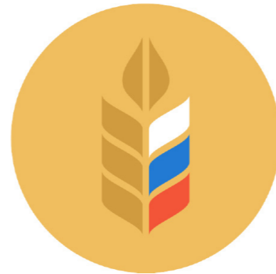
Министерство сельского хозяйства Российской Федерации