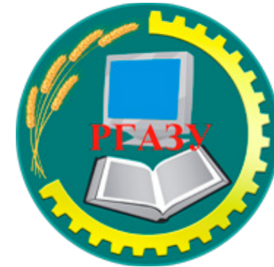
ФГБОУ ВО Российский государственный аграрный заочный университет